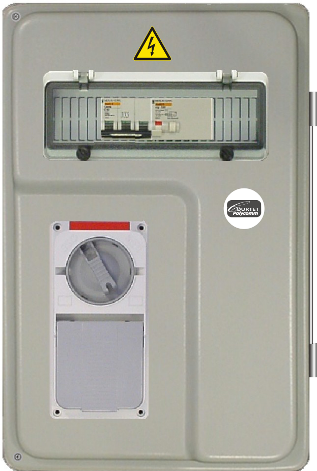
TABLEAU INDUSTRIEL 1 PC TRI 400V/32A