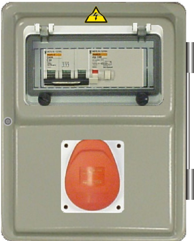
TABLEAU INDUSTRIEL 1 PC TRI 400V/16A