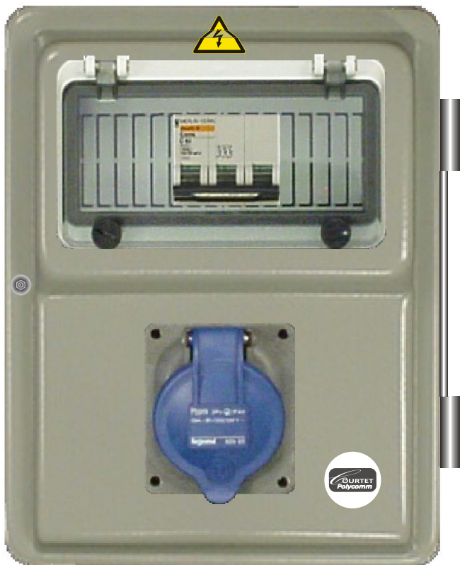
TABLEAU INDUSTRIEL 1 PC TRI 230V/16A