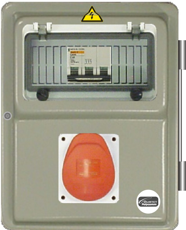
TABLEAU INDUSTRIEL 1 PC TRI 400V/16A